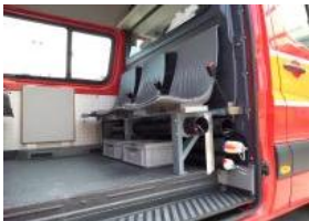
Abbildung einer bauähnlichen Ausführung: