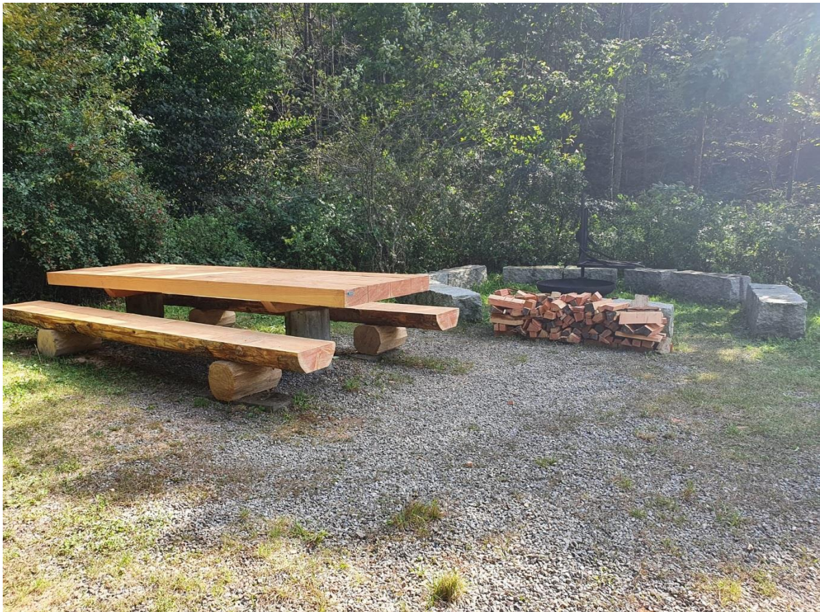
Feuerstelle im Teufental

Der Forstbetrieb Uerkental hat auf Wunsch des Gemeinderates den Tisch sowie die Bänke bei der Brätlistelle im Teufental ersetzt.